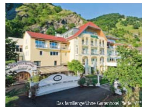
Das familiengeführte Gartenhotel Pfefferl 4****

Im Herzen von Melk erwartet Sie ein traditionsreicher Familienbetrieb, mit regionalen Gaumenfreuden preisgekrönter Küche. Genießen Sie einen Abend im historischen Weinkeller, verweilen Sie im romantischen Arkadenhof und erholen Sie sich in einem der geschmackvollen Genießerzimmer.