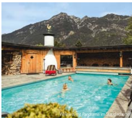
Wellness mit Panorama im Staudacherhof

Auch im traditionsreichen Aktivhotel Sonnenspitze lässt es sich herrlich verweilen. Sei es auf einer der Sonnenterrassen mit Blick in die Bergwelt des Zugspitz-Massivs, im kleinen, aber feinen Wellnessbereich mit Sauna und Dampfbad oder in den gemütlichen, im regionalen Stil gestalten Zimmern. Im Hotel-Restaurant wird Tiroler- und Österreichische Küche serviert.