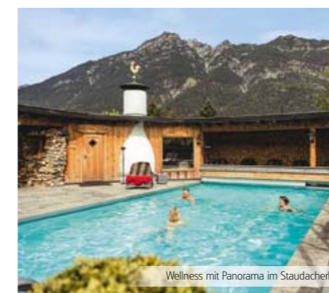
Wellness mit Panorama im Staudacherhof

Auch im traditionsreichen Aktivhotel Sonnenspitze lässt es sich herrlich verweilen. Sei es auf einer der Sonnenterrassen mit Blick in die Bergwelt des Zugspitz-Massivs, im kleinen, aber feinen Wellnessbereich mit Sauna und Dampfbad oder in den gemütlichen, im regionalen Stil gestalten Zimmern. Im Hotel-Restaurant wird Tiroler- und Österreichische Küche serviert.