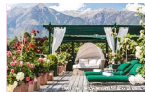
Das Hotel Pienzenau am Schlosspark 4****S

Wunderbar ruhig in der Villengegend von Meran gelegen, mit Innen- und Außenpool, Wellnessbereich, Dachterrasse mit herrlichem Blick auf Meran und ein gediegenes Restaurant mit exquisiter Küche. Die Zimmer sind elegant im Südtiroler Stil ausgestattet.